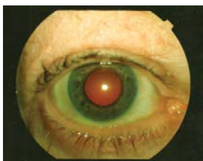
Figure 2: Photo du segment antérieur illustrant l'hypopyon résorbé et une chambre antérieure claire.